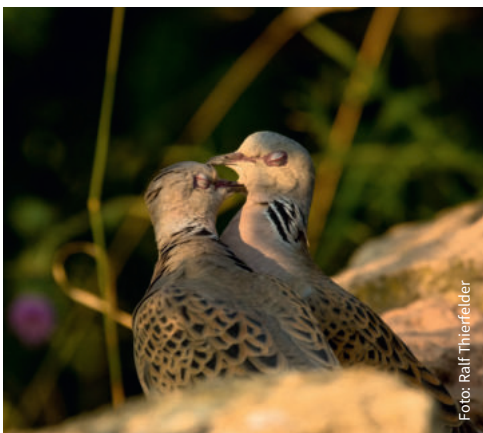
Turteltauben ( Streptopelia turtur )